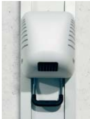
Douche à air chaud Vendaval réglable en hauteur, avec radar HF