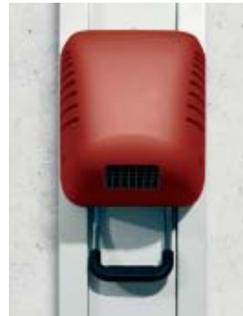
Douche à air chaud Vendaval réglable en hauteur, avec radar HF