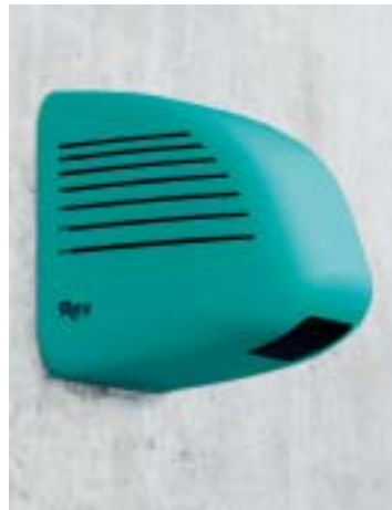
Douche à air chaud Vendaval, montage fixe, avec radar HF